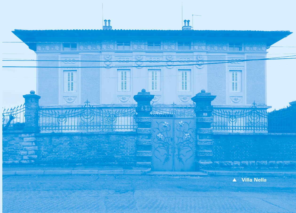
▲ Villa Nella