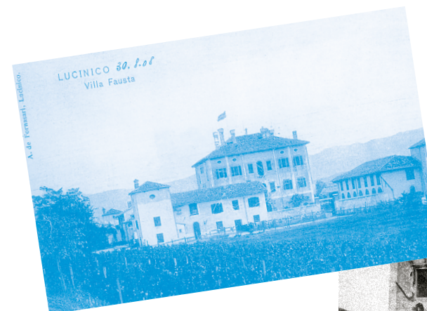
▲ Villa Fausta ►

È evidente che la scelta di Svevo non è casuale, nel contesto della grande Guerra Lucinico ha una precipua dimensione temporale e uno spazio fisico definito, che lo hanno trasformato in teatro di eventi tragici che a tutt'oggi contribuiscono a caratterizzarlo. La sua identità viene determinata anche da questi fatti, la tragicità della guerra è un criterio dinamico che fa assumere un ulteriore significato al paese: lo scrittore lo coglie con un'immediatezza straordinaria, evidenziando ancora una volta una grande sensibilità e la sua proverbiale genialità letteraria.